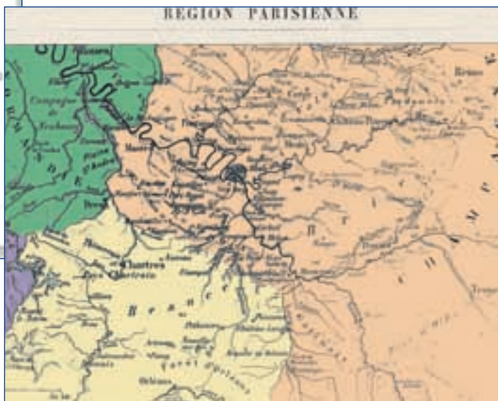
Carte de l'Île-de-France (extrait) de Vidal de La Blache