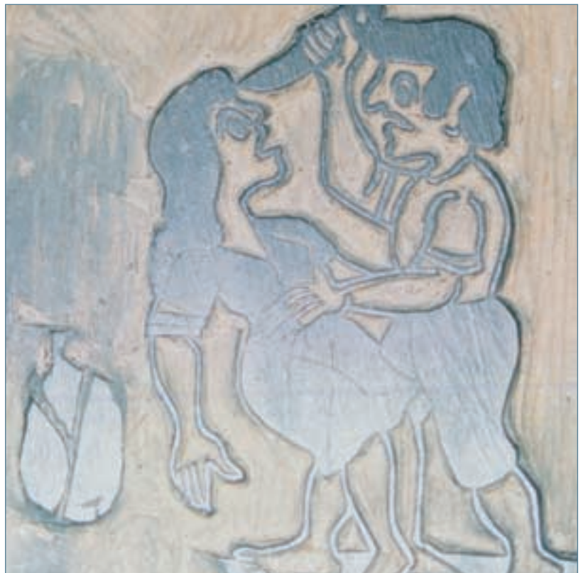
«Le fils qui a tué sa mère pour un fruit du jaquier»