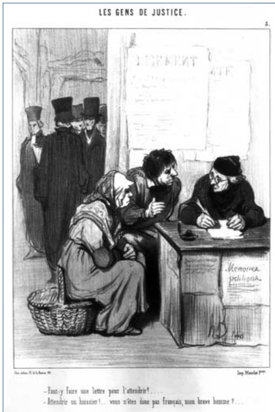
DAUMIER, Honoré.- Les gens de justice. - Paris : André Sauret, 1966.-131 p, ill, 32 cm

Parallèlement à cette activité très riche concernant les documents imprimés, la bibliothèque a développé très tôt l'accès aux ressources électroniques : la possibilité d'interroger des banques de données en ligne, des cédéroms, la constitution d'un site web* très riche ont très vite constitué une priorité pour optimiser la qualité de la recherche documentaire. Aujourd'hui 150 titres