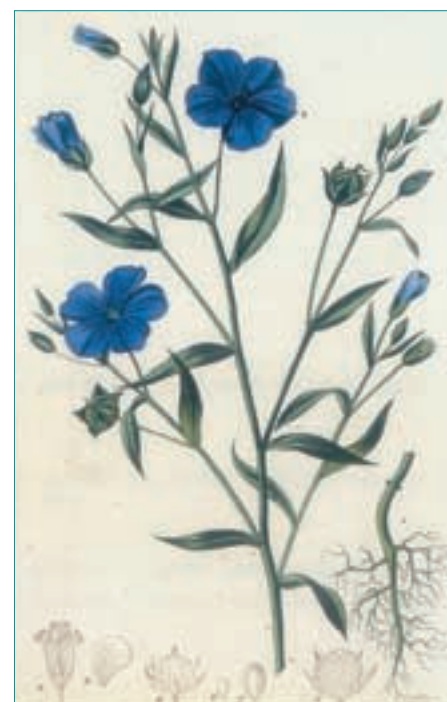
4-b : Lin pl. 220