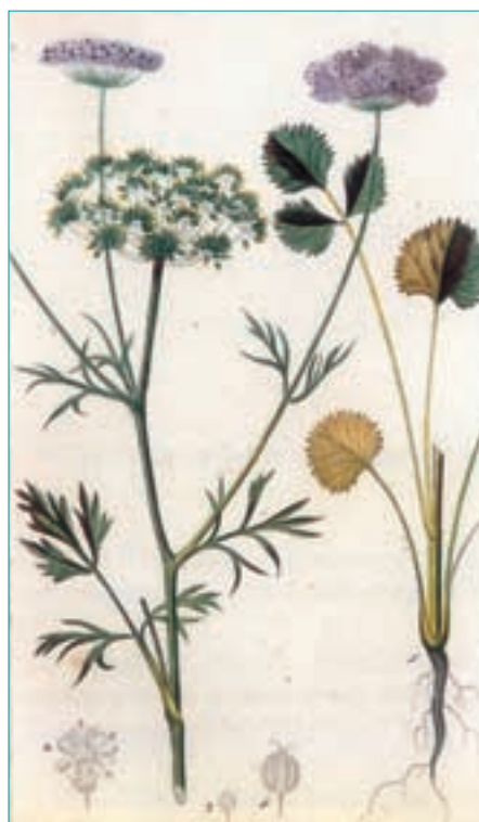
4-a : Anis pl. 29