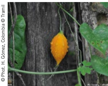
➔ Momordica charantia , photographie extraite de Tramil, programme de recherche appliquée à l'usage des plantes médicinales dans la Caraïbe.