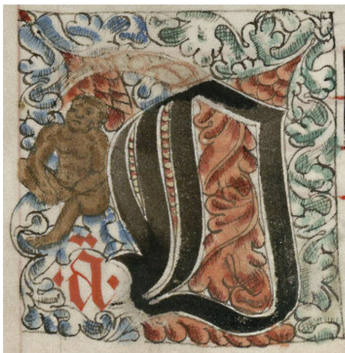
➤ Lettrine ornée d'un maure nu, 1500-1600. Détail extrait d'un manuscrit (Antiphonaire, BmN, Ms 437), publié sous licence ouverte dans « Bibliothèque Renaissance à Nancy » (Bibliothèque-médiathèque de Nancy).

Ces initiatives sont des témoignages de l'avancée du mouvement de l'Open Data en France depuis 2011, approprié désormais assez largement par les institutions et administrations publiques, y compris pour les données culturelles. La publication de la feuille de route du ministère de la Culture en avril dernier est à cet égard significative. La BNU s'inscrit donc dans un contexte d'ouverture progressive des données, mais aussi de sensibilisation accrue