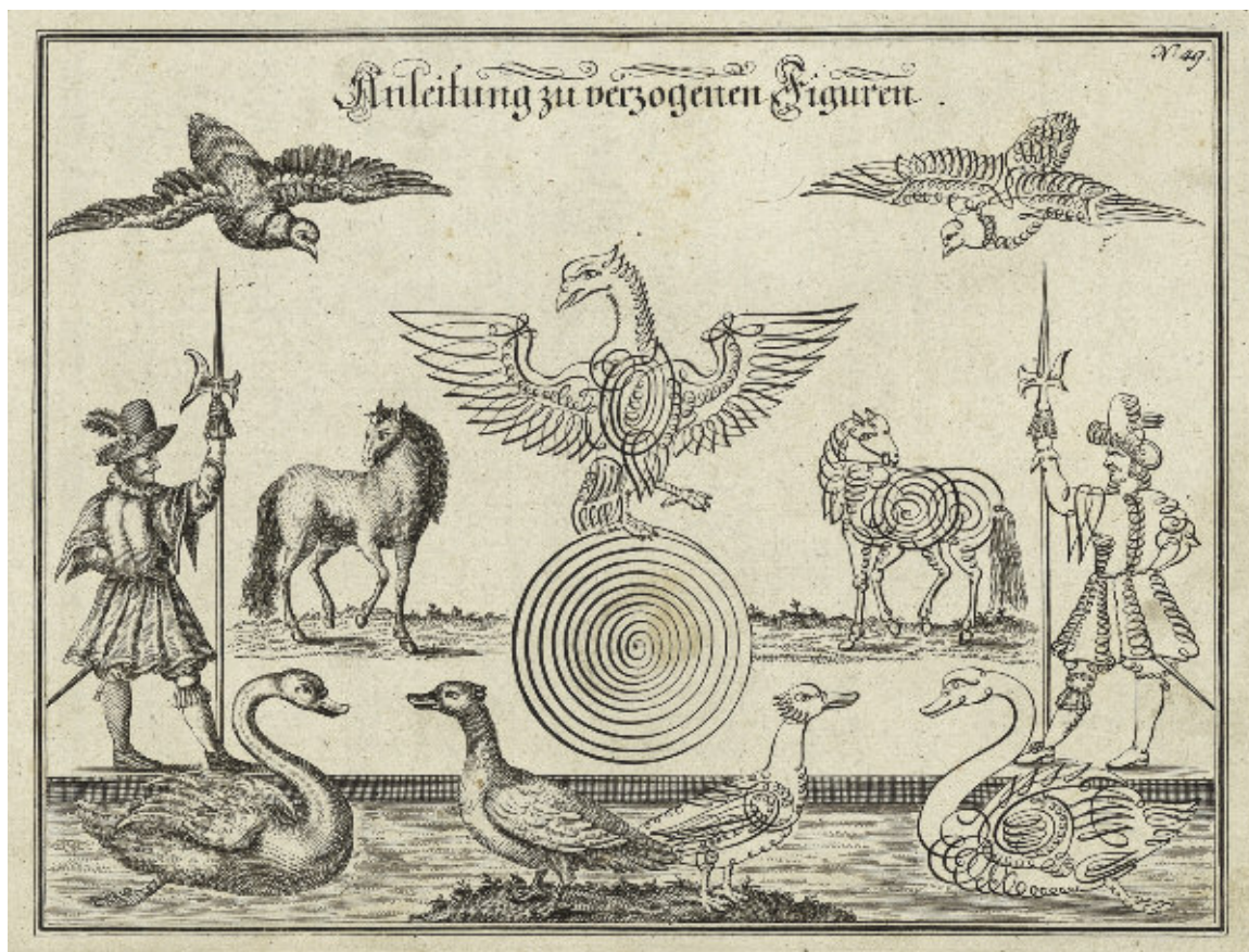
➔ Johann Michael Schirmer, Schreibschule oder Deutsche, Lateinische und Französische Vorschriften . Andräeischen Buchhandlung, [1760] (Cote BNU : FSO.285.A). Cette image sera bientôt accessible sous licence ouverte sur Numistral, la bibliothèque numérique de la BNU, ouverte au public à la rentrée 2013.

• la redevance d'usage jusqu'alors demandée en cas de réutilisation de fichiers numériques par un tiers était relativement mal vécue par nos publics, notamment par les publics académiques et les sociétés savantes, cœur de cible de la BNU. L'abandon de la redevance devait permettre d'améliorer l'image de l'établissement et les relations avec