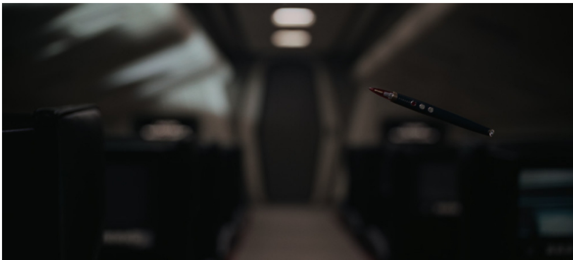
Figure 5. – 2001, l'Odyssée de l'espace (Stanley Kubrick, 1968), photogramme personnel.

17 Mais la question demeure : quel est le rapport entre l'os, l'ordinateur et le stylo ? Entre l'os et l'intelligence artificielle ? Ce rapport peut être précisé à partir de la séquence où Dave Bowman tente de débrancher HAL 9000. Il n'est pas inutile de résumer les enjeux scénaristiques de la scène. Dans le cas qui nous occupe, Hal a verrouillé l'accès à la navette. Il contrôle les commandes et les