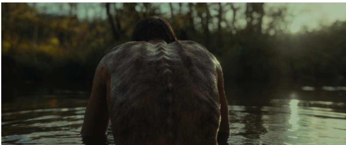
Figure 7. - Le Règne animal (Thomas Cailley, 2023), photogramme personnel.