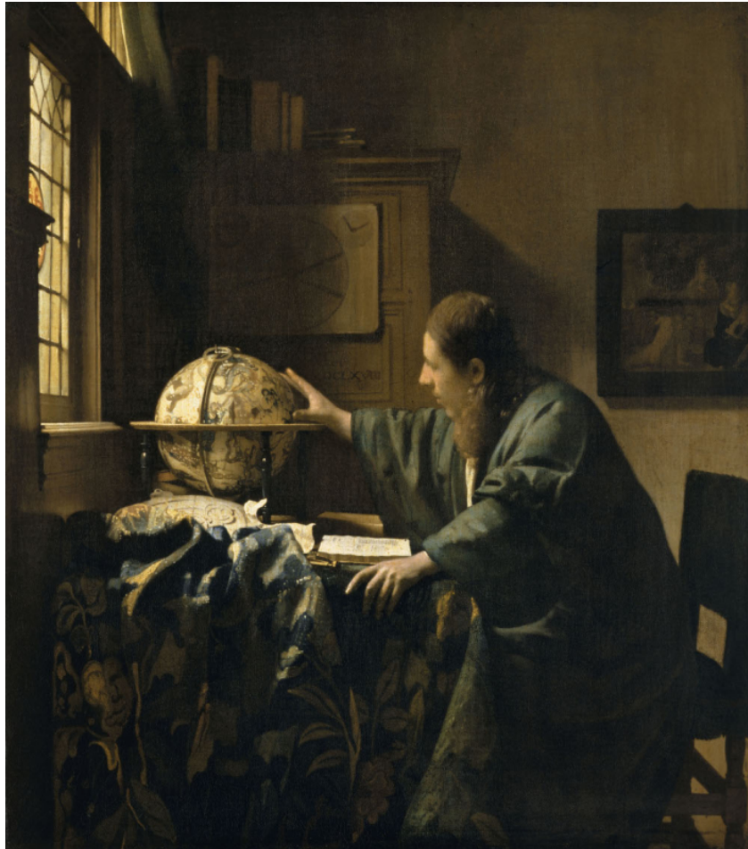
Figure 1. – Johannes Vermeer, L'Astronome , 1668, huile sur toile, Musée du Louvre.