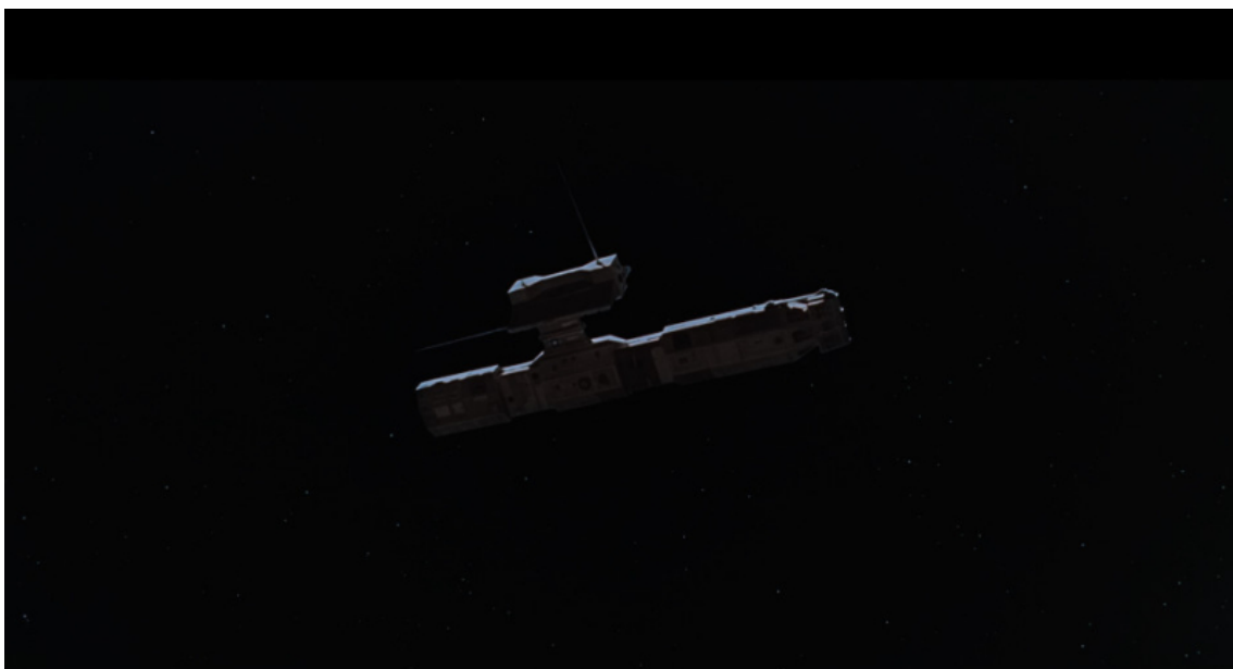
Figure 3. – 2001, l'Odyssée de l'espace (Stanley Kubrick, 1968), photogramme personnel.

pas d'une domination technique du monde » (2011, p. 128). Mais il faudrait une lecture plus patiente du film en évacuant les lectures, sans doute phallocentriques et œdipiennes, obsédées par une vision érotique et génitale ( ibid. , p. 134).