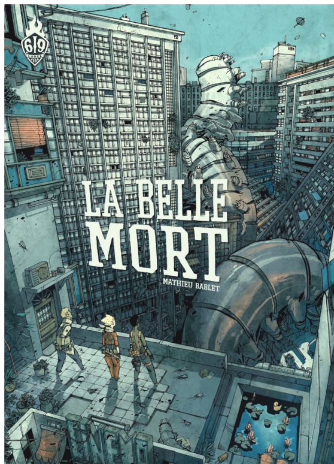
Figure 1. – Mathieu Bablet, 2011, La Belle Mort , Ankama Éditions, coll. « Label 619 », couverture.

Dans Shangri-La , la Terre est devenue inhabitable à la suite d'un grand cataclysme. Les humains qui ont survécu vivent dans une station orbitale dirigée par une grande entreprise capitaliste. Les gouvernants développent le projet de créer une nouvelle espèce humaine, à partir de quelques atomes, et de l'implanter sur un satellite de Saturne. En réalité, la vie de la station est traversée par