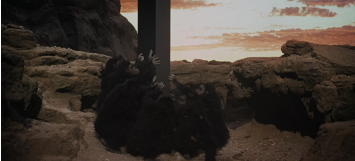
Figure 2. – 2001, l'Odyssée de l'espace (Stanley Kubrick, 1968), photogramme personnel.