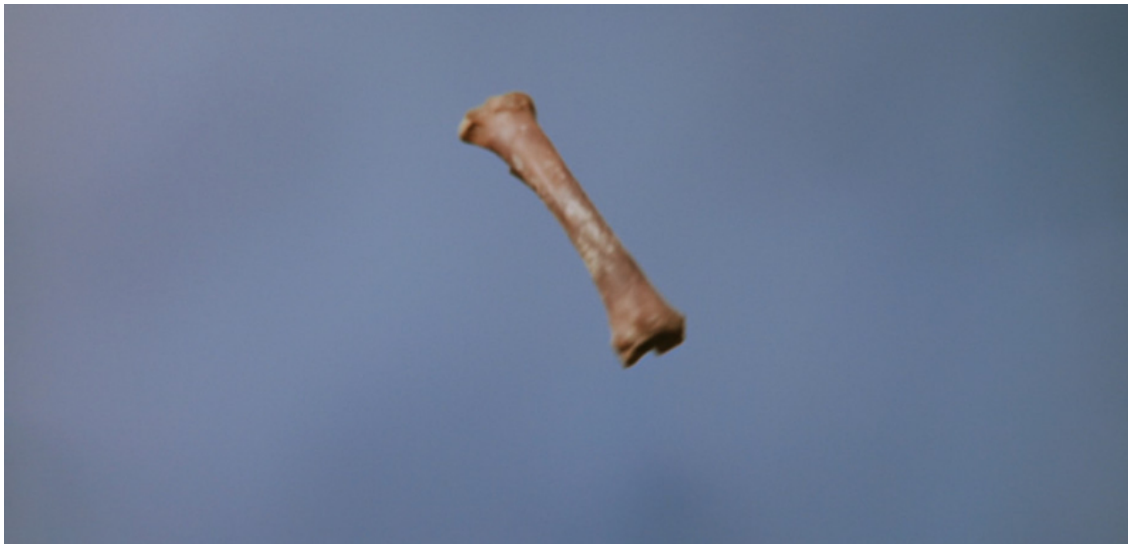
Figure 4. – 2001, l'Odyssée de l'espace (Stanley Kubrick, 1968).