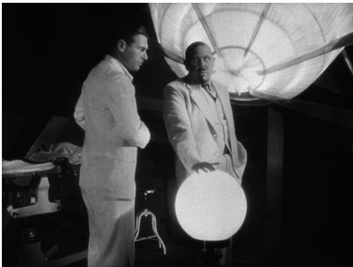
Figure 6. - L'Île du docteur Moreau (Erle C. Kenton, 1932), photogramme personnel.

Moreau est aussi un « hors-la-loi », il défie les lois du vivant, c'est-à-dire qu'il déclenche l'humanité en l'animal par la manipulation génétique. En ce sens, Moreau provoque l'humanité en réécrivant les lois du vivant. Mais la particularité de la posture scientifique de Moreau, c'est qu'elle renoue, à plus forte raison, avec une certaine iconographie picturale héritée de Vermeer. Dans l'une des séquences du film, Moreau fait la visite de son laboratoire à Park. Tout en vantant le fruit de son génie et la grande précision de son équipement d'intervention chirurgicale, il dispose sa main droite sur une sphère de lumière. La séquence, cadrée en plan moyen, laisse alors apparaître les dispositifs médicaux. Bien que le plan ne puisse pas évacuer les figures de la maîtrise (la main, le globe), cette partie du récit est importante car elle dit que Moreau est tout entier un personnage du toucher dont la main est l'entité créatrice.