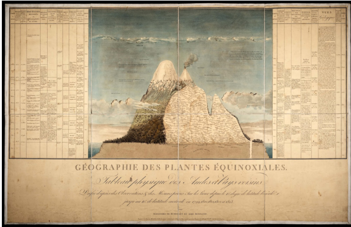
Alexander von Humboldt und Aimé Bonpland, Essai sur la géographie des plantes , Paris, Levrault, Schoell et compagnie, 1805, p. 156; Biodiversity Heritage Library, Missouri Botanical Garden, Peter H. Raven Library, CC BY-NC-SA 4.0