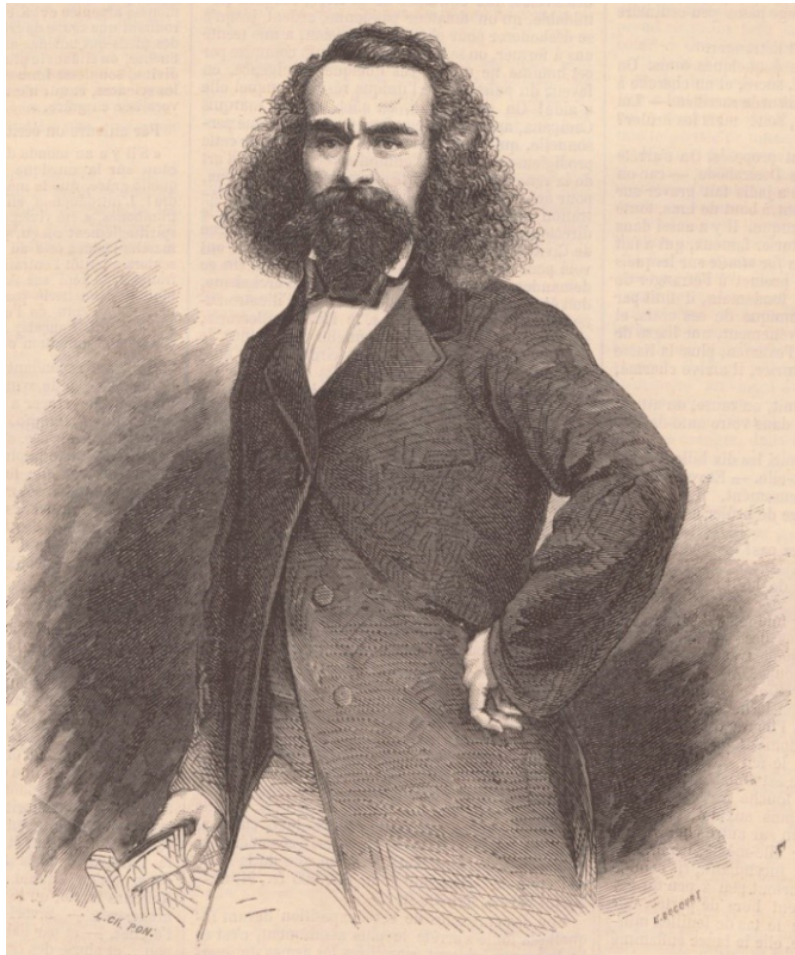
Le Monde illustré , 10 mai 1862.